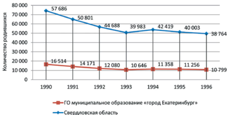
Рис. 3. Рождаемость за 1990–1996 гг. в Свердловской области и Екатеринбурге, чел. [6]

альностей, к обучению на коммерческой основе принимаются абитуриенты с низкими баллами ЕГЭ. Как отмечают Л.М. Капустина и Е.А. Жадько, молодежь нередко больше ориентирована на статус образования, чем на результат – получение необходимых знаний, умений и компетенций, что приводит к снижению качества образования [2. С. 25]. Одной из проблем профессионального образования является недостаточно активное участие объединений работодателей в создании и общественно-профессиональной экспертизе Федерального государственного образовательного стандарта профессионального образования нового поколения и разработке на их основе новых модульных образовательных программ [1. С. 10].