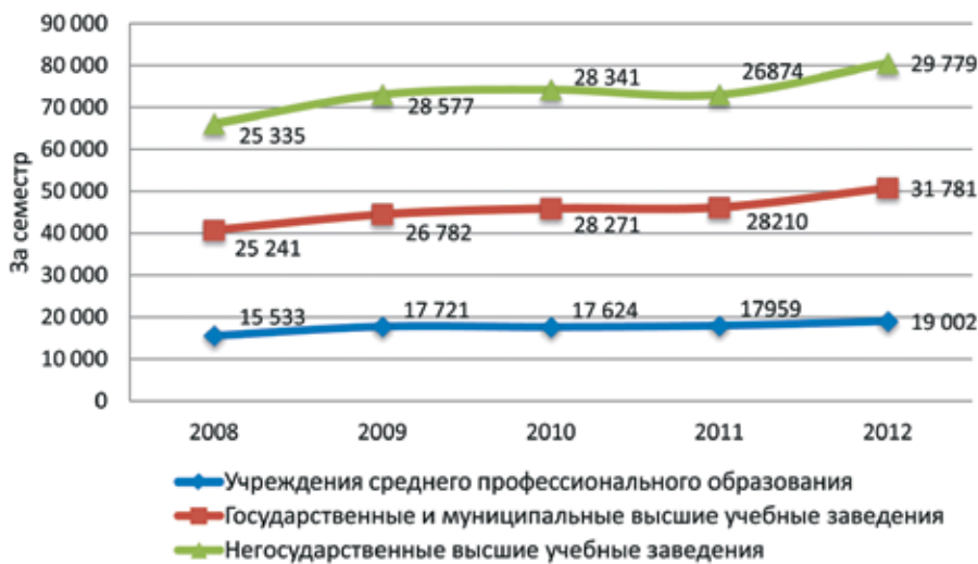
Рис. 4. Средние потребительские цены на отдельные виды услуг образования (на конец года), р. [5. С. 44]

ственно полезной деятельности в соответствии с потребностями общества и государства, а также на удовлетворение потребностей личности в углублении и расширении образования [3].