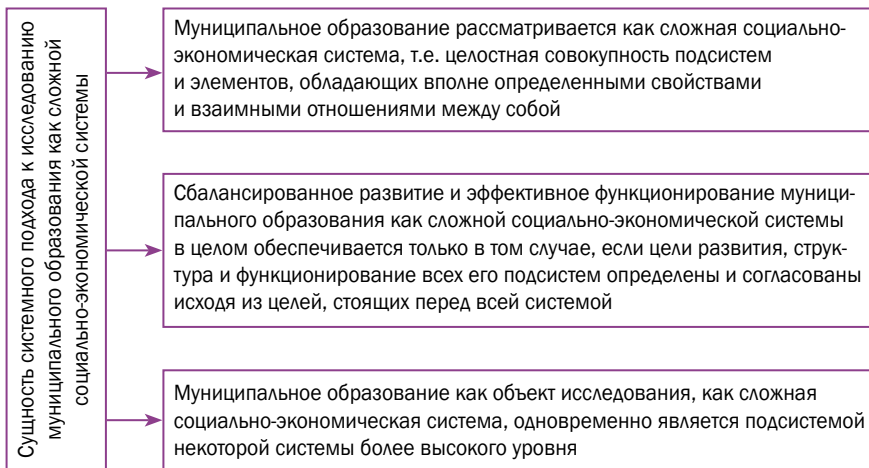
Рис. 1. Основные положения системного подхода к исследованию муниципального образования

их взаимосвязи, учесть влияние внешних условий на процессы муниципального экономического развития. Изучение муниципального образования как социально-экономической системы стало уже традиционным, что подтверждается наличием соответствующих разделов в учебной литературе по местному самоуправлению и муниципальному управлению (см, например, [32]). Однако если само по себе отнесение муниципальных образований к классу социально-экономических систем не подвергается сомнению, то вопрос о структурировании муниципального образования как сложной социально-экономической системы является достаточно дискуссионным.