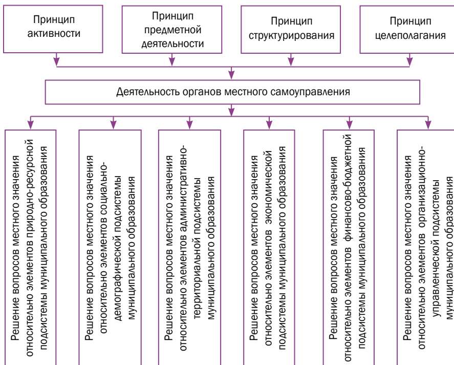
Рис. 4. Направления деятельности органов местного самоуправления