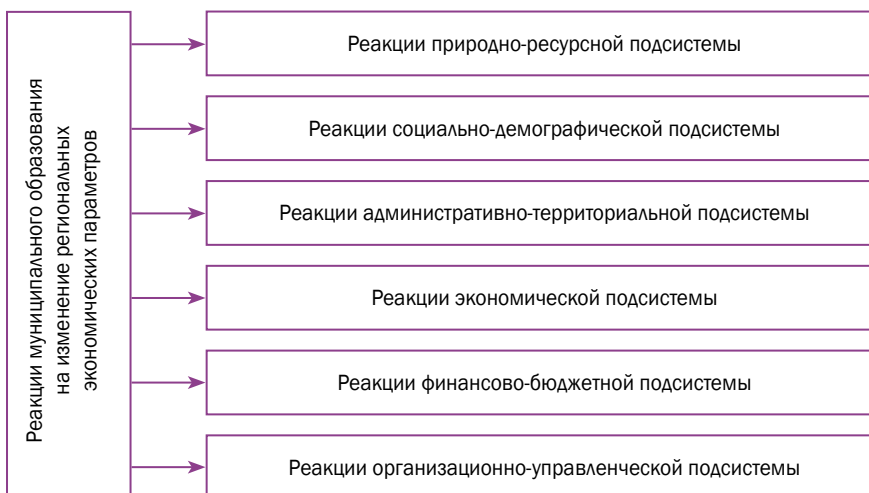
Рис. 3. Классификация реакций муниципального образования как сложной социально-экономической системы

Организационно-управленческая подсистема включает совокупность муниципально-правовых норм, закрепляющих структуру органов местного само-