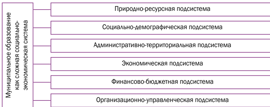
Рис. 2. Структура муниципального образования как сложной социально-экономической системы

лификационному составу, принадлежности к различного рода политическим и общественно-политическим организациям, по вероисповеданию и т.п., а также характеристику процессов, закономерностей, тенденций, происходящих в обществе. Реакции социально-демографической подсистемы охватывают весь спектр действий в сфере реализации социальной и демографической политики, социальной защиты населения, функционирования объектов социальной инфраструктуры муниципального образования, формирования общественного мнения, а также в сфере общественно-политической деятельности.