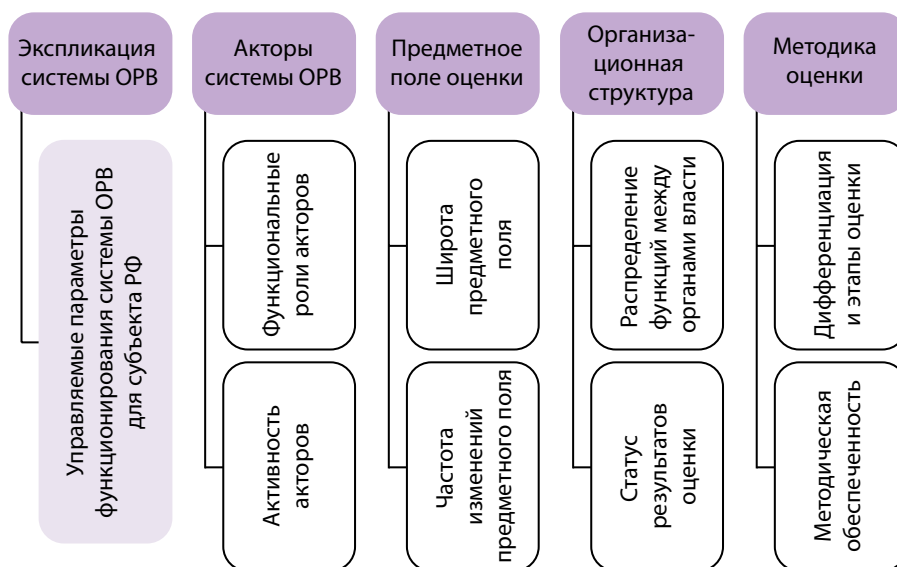
Рис. 1. Систематизация управляемых параметров функционирования системы ОРВ субъекта РФ по основным элементам экспликации

Экспликация объекта, представляющего собой управленческую систему, каковой, в частности, является система ОРВ в субъекте РФ, проведена по общепринятым основаниям [4; 10; 14] и включает следующие блоки: акторы и организационная структура системы ОРВ, предмет и методика оценки.