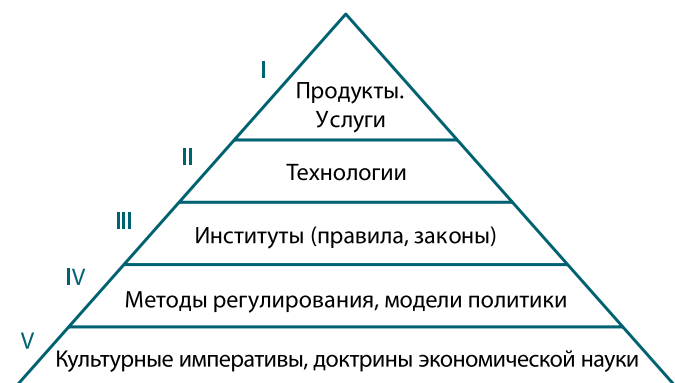
Рис. 3. Распределение видов импортозамещения по уровню значимости согласно предмету замещения Fig. 3. Import substitution types according to the subject of substitution and the significance level

Безусловно, при формировании рассматриваемой политики следует принимать во внимание различные виды самого импортозамещения (рис. 3), причем в зависимости от вида согласно предмету замещения определяются и мероприятия политики, влияющие на успех вытеснения импорта с внутреннего рынка. Это вытеснение может происходить путем последовательного замещения собственными возможностями и с наращиванием результатов («интенсивное импортозамещение») либо может свестись к прекращению использования импортных изделий от одних поставщиков, которые ввели санкции, и переключению на других поставщиков («параллельный импорт») с отсутствием или незначительными изменениями в собственном производстве («экстенсивное импортозамещение»). К этому же виду производства можно отнести отказ от импорта с его копированием или воспроизведением либо освоение размещенных в стране иностранных активов (технологий), которые не удалось вывести в результате ответных санкций, если это освоение происходит без создания собственных возможностей. Тем самым интенсивный тип политики замещения импорта связан с развитием собственной производственно-технологической базы и созданием продукции, которая хотя бы на последующих этапах превзойдет по характеристикам импортные изделия.