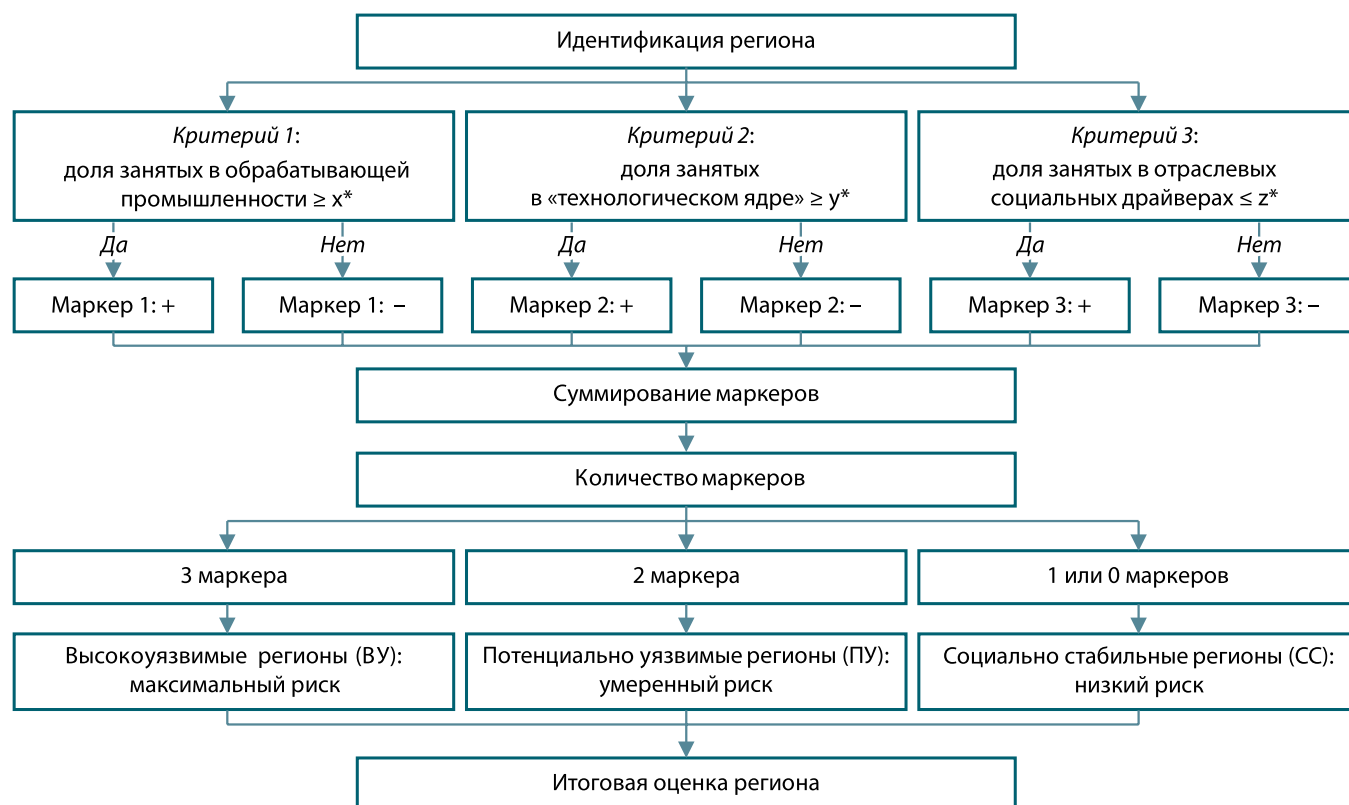
Рис. 2. Алгоритм идентификации регионов с точки зрения социальной уязвимости

Несмотря на кажущуюся простоту, алгоритм предполагает нюансы, связанные с выявлением пороговых значений x^* , y^* и z^* . Данные границы определялись эмпирически на основе следующего правила: все регионы ранжируются по долевым показателям x , y и z по убыванию; при определении x^* и y^* занятость в соответствующих секторах экономики регионов суммируется сверху вниз до тех пор, пока итог не превысит 50 % всех занятых секторов; при определении z^* занятость в секторах экономики регионов суммируется снизу вверх до тех пор, пока итог не превысит 50 % всех занятых секторов. Данное правило помогает установить наиболее «массивные» регионы, совместно аккумулирующие более половины рабочих мест, и тем самым гарантирует, что мы не упустим значимые региональные зоны уязвимости. Вычислительные эксперименты позволили определить следующие пороговые значения: x^* = 15\% (занятость в маркированных регионах составляет 55,4 %), y^* = 8\% (занятость в маркированных регионах составляет 53 %)