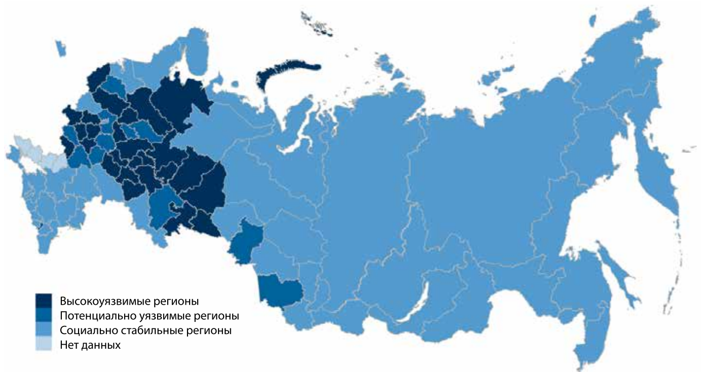
Рис. 3. Картография регионов России по уровню социальной уязвимости

При диагностике социальной уязвимости регионов были учтены главные факторы – интенсивность робо-